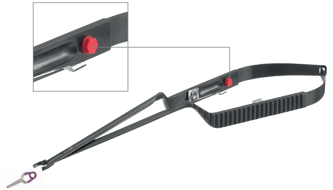
カラーコード 赤: ミニクリップ用鉗子