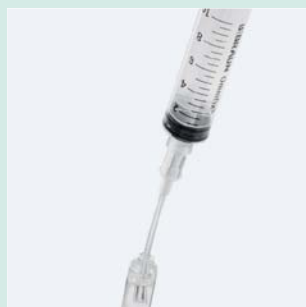
フィルターストロー (FS5000 / FS5005)