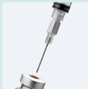
フィルターニードル (FN5019)