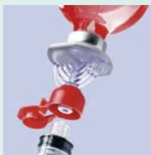
ケモミニスパイク V

ビー・ブラウンは、薬液調製業務の清潔性・安全性に貢献しながら、効率的に薬液調製を行うための各種製品を提供し、より良い環境造りのサポートをいたします。