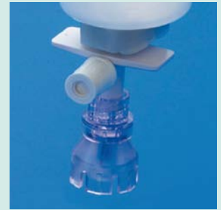
ディスペンシングピン (DP1500)

吊るした状態で保管をするエア針が必要なガラス容器からの吸引や注入時に使用する器具