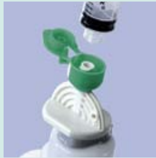
ミニスパイクプラス (グリーンキャップ)