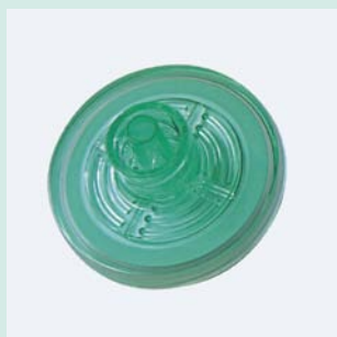
コニカルフィルター