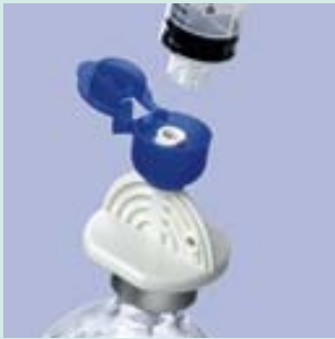
ミニスパイクプラス (ブルーキャップ)