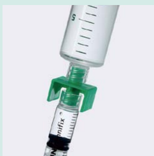
ディスペンシングコネクタ (FDC1000)