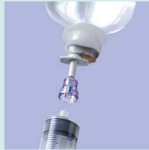
ディスペンシングピン (DP3500L)

吊るした状態で保管をするエア針不要のプラスチックボトル・バックからの吸引や注入時に使用する器具