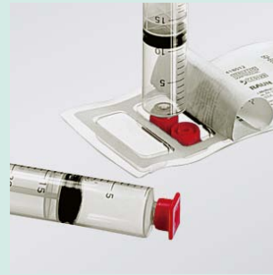
シリンジキャップ (SC2000)